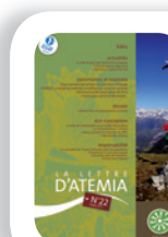
Trois Lettres d'information reçues par 1000 lecteurs.