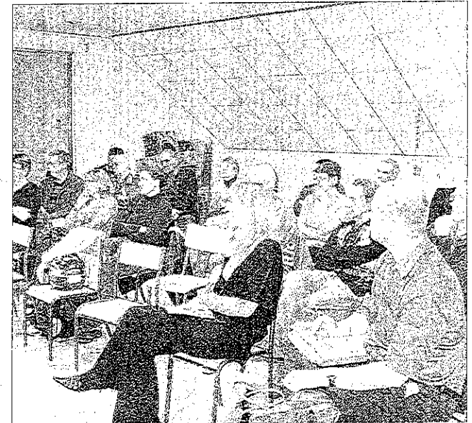
Les habitants des Grangettes sont venus nombreux.